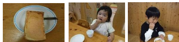
たらこトースト と昆布