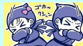
イラスト：青鹿ユウ

咳をする時、口元を手のひらで覆っていませんか？実はこれは、多くの人がしている誤った咳エチケット。咳の飛沫で出た菌やウイルスを手で受け止めると、そこから感染を広げてしまいます。園では、咳をする時は、右図のように、「忍者に変身！」スタイルなど、咳を腕で防ぐことを子ども達に勧めています。